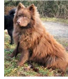
Großspitz braun