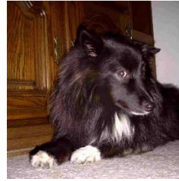
Großspitz schwarz mit Abzeichen